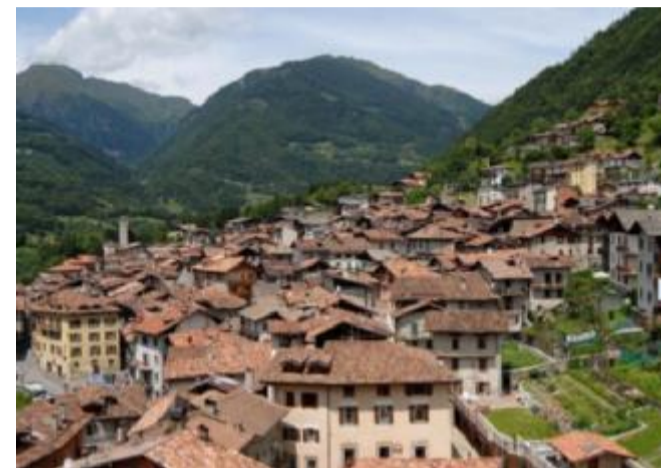
Gli ambiti: sociale-sociosanitario, tutela patrimonio, storia-ambiente, cultura

La parte più ampia alla Valcamonica poi Valsabbia, Valtrompia e Bassa